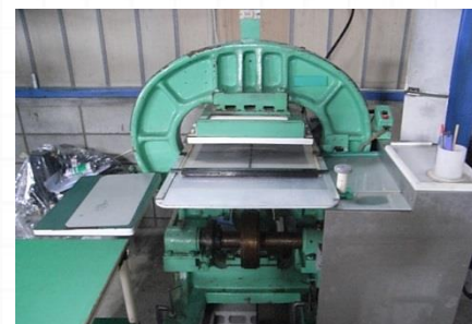
手動裁断機 ガルマ