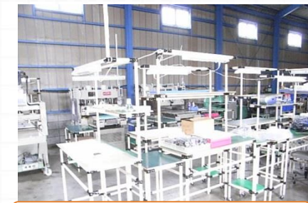
貼り加工セル工程