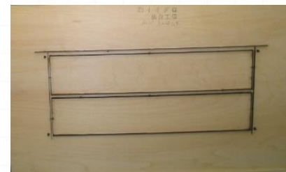
ビク型サンプル一例