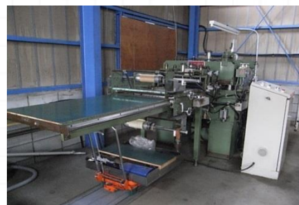
油圧全自動裁断機