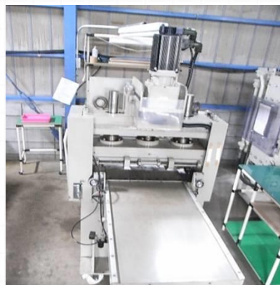
自動裁断サーボプレス